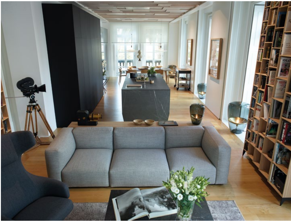
Derecha: plano de trabajo realizado en material porcelánico acabado Mármol Gris, con fregadero integrado. Direita: plano de trabalho realizado em material porcelânico acabamento Mármore Cinza, com lava-loiça integrado. Right: worktop made in porcelain with Grey Marble finish, with an integrated sink.